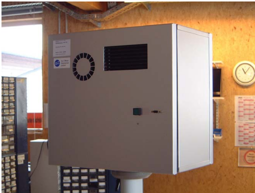
Bild: Rückseite IPC115

Die Kühlung erfolgt über die Gehäuseoberfläche und ein Zwei-Kreis-Kühlsystem Hochwertige Flachgebläse mit Hochleistungskühlkörpern sorgen für eine effektive Kühlung und wartungsfreien Staubschutz