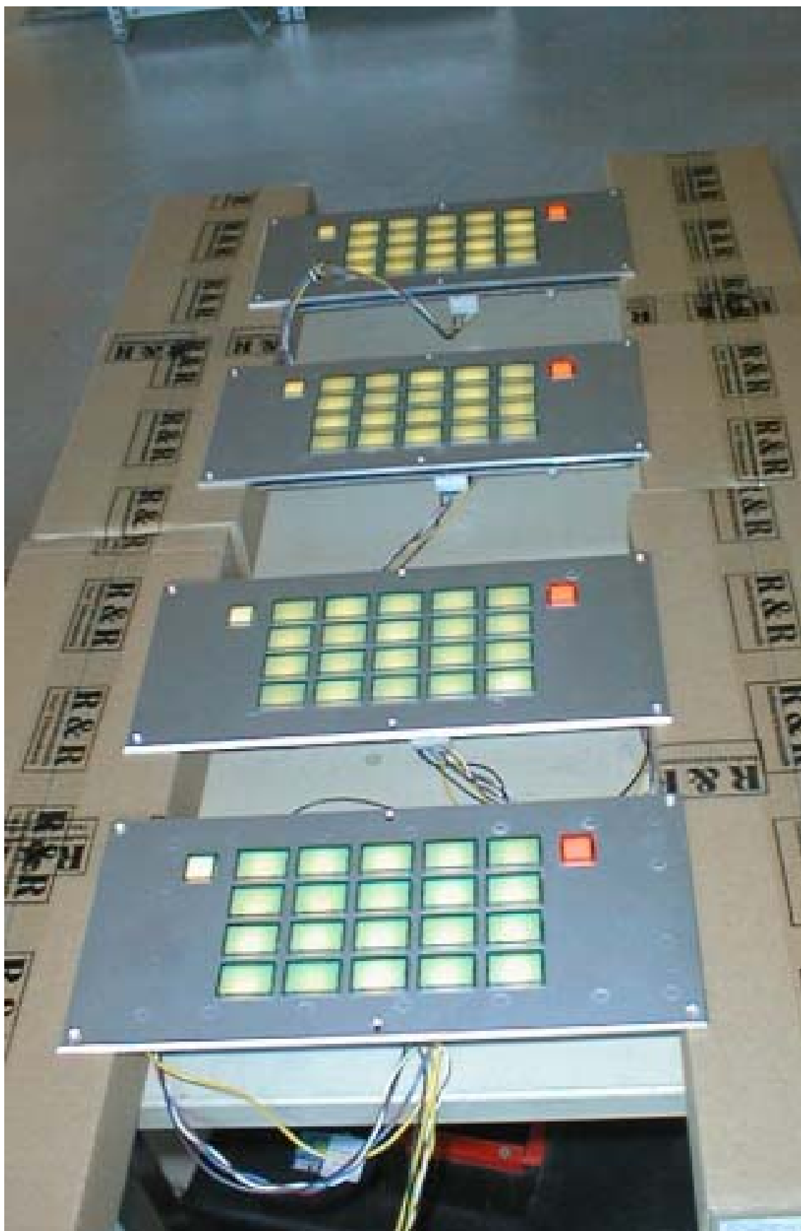
R&R Industrie-Tastatur IKL1-101 - für raue Umwelt -